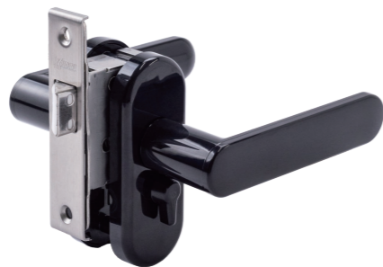
樹脂ケースとセット状態