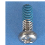
P1-S14-027L 盘头小机钉 M4×12