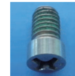
P1-S15-010N 门把手固定螺丝 M5×8