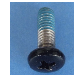
P1-S17-KB6 平头小机钉 M4×12 (B)