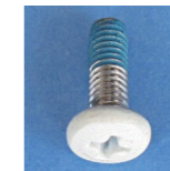
P1-S17-WH6 平头小机钉 M4×12 (W)