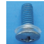
P1-042CAS-150 圆沉头小机钉 M4×12 带垫片