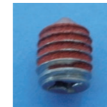
P1-S16-120N 尖头螺丝 M6×8