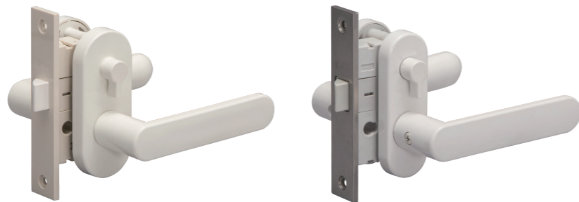
树脂锁体和把手配套状态