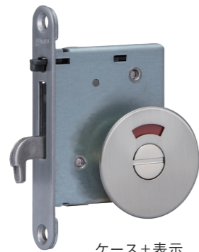
上鎌錠 BS38 ストライクに鎌が上からかかります。 バックセットは 38mm です。