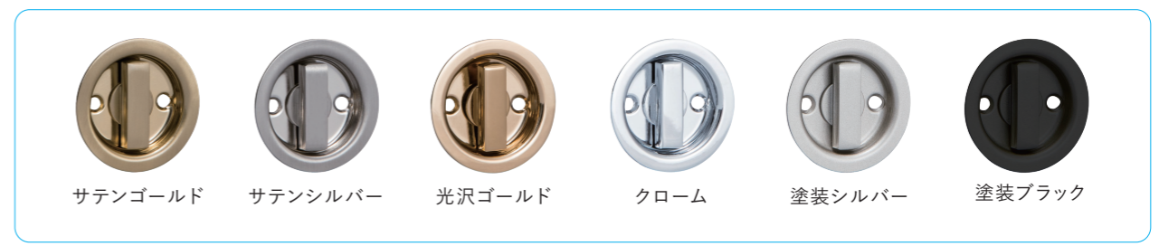
仕上げ / 色調