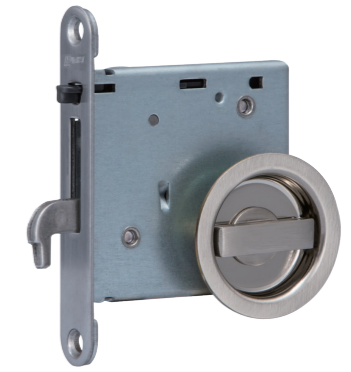
標準タイプ (室内側)