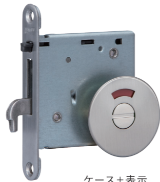
上鎌錠 BS51 ストライクに鎌が上からかかります。 バックセットは 51mm です。