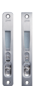
丸型 角型 調整ストライク (上鎌錠)