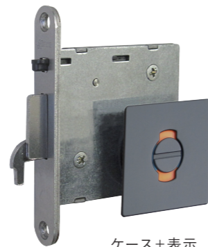
デッドボルト錠 BS51 ストライクに鎌が上からかかり、 同時にデッドボルトが突出します。 バックセットは 51mm です。